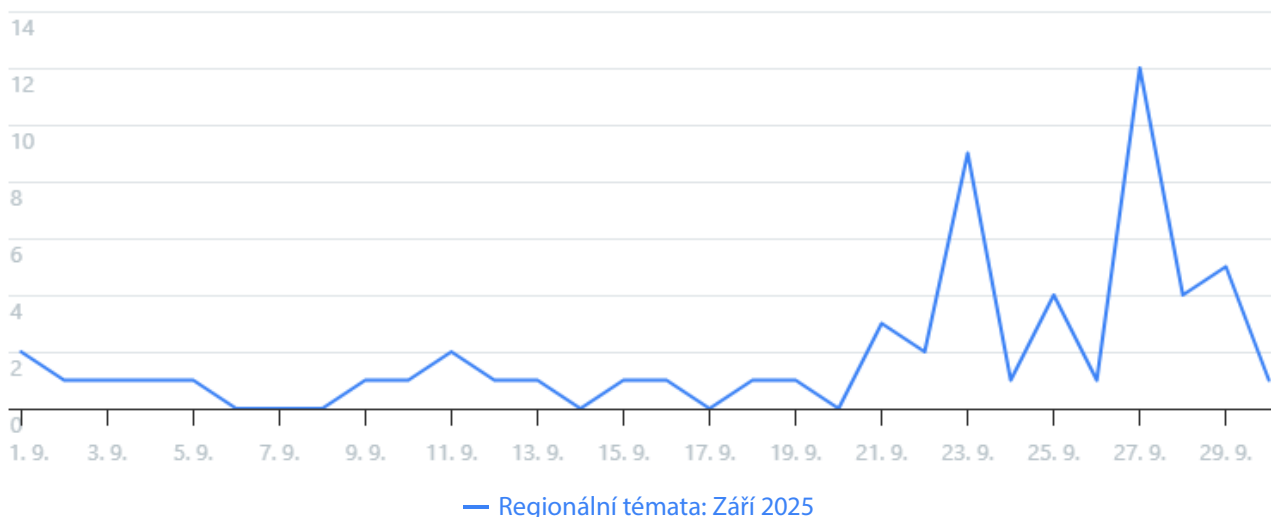
Graf 2: Graf zobrazuje četnost publikování příspěvků v čase.

V celkovém objemu komunikace převládala aktivita opozičních hnutí, přičemž mezi nejvíce sdílenými příspěvky se objevovala i témata kombinující politické narativy s tématem zdravotnictví – například zavádějící tvrzení o očkování či mRNA technologiích. Přibližně 36 % relevantního obsahu tvořily zprávy z webu Zvědavec, které kromě českých regionů reflektovaly i údajné zasahování do voleb v Moldavsku . Tyto texty vycházely z překladů ze zahraničních zdrojů, včetně ruských. Naproti tomu obsah zaměřený na regionální dění udržoval převážně neutrální a zpravodajský charakter, například informování o místních referendech na Vysočině konaných souběžně s volbami do Poslanecké sněmovny. Podobné zprávy měly ale zároveň menší dosah než polarizující obsah zmiňovaný výše.